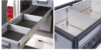
Avdelare för extra lång låda