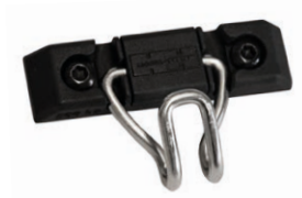
Lastsurringskrok för T-spår