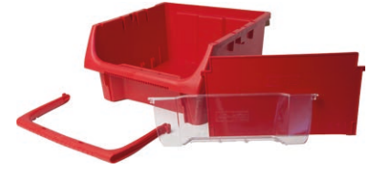
Modul-Box, 324 mm bred