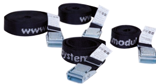
Surrning 0.8-4.0 m

Lastsurringar finns i diverse längder och kapacitet.