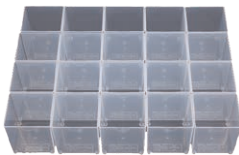
20 insatslådor för låg Mobil-Box