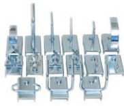
Verktgshållarsats 915, 15 st