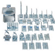
Verktgshållarsats 930, 30 st