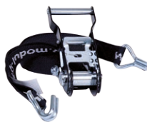
Surrning med spännare och J-krokar 4.5 m