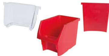
Modul-Box, 162 mm bred