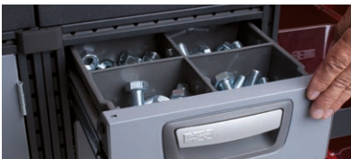
Kit med lådinsatser för 108 mm höga lådor