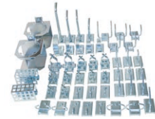
Verktgshållarsats 950, 50 st