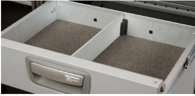
Avdelare för hurtslåda