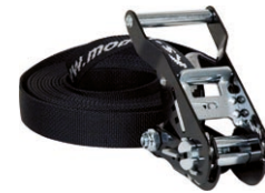
Surrning med spännare 4.5 m