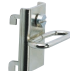
Typ 9 - Avsedd för surringar i anslutning till verktygsplåt