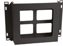
Förrävarsfack för Mobil-Box