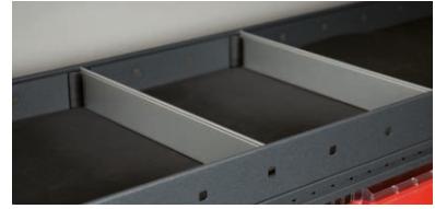
Avdelare för standardhylla